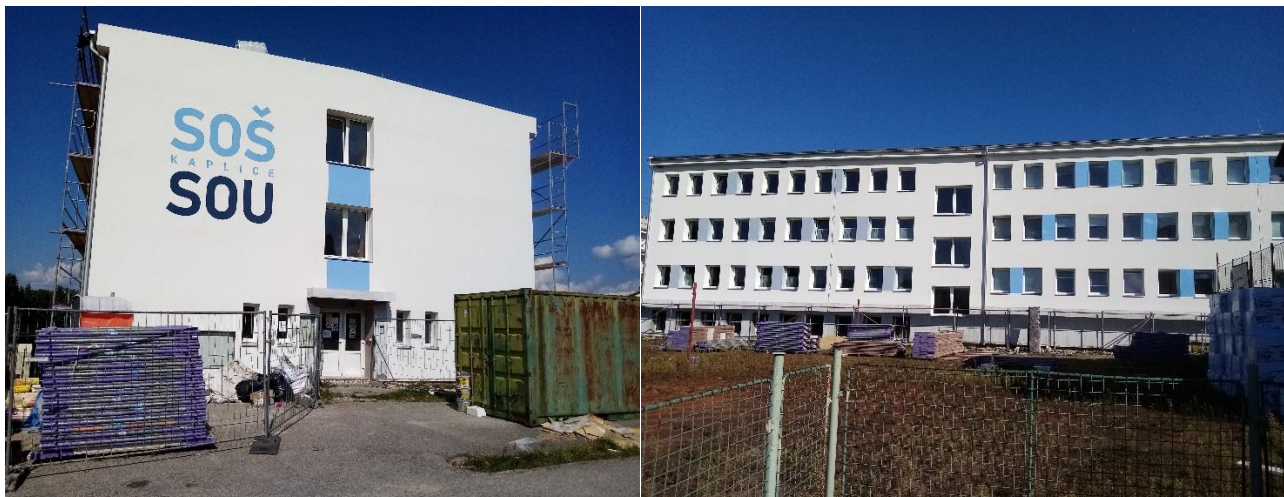
Obr. 22 – revitalizace budovy SOU

Další investice do budovy SOU představuje modernizace 2 odborných učeben a toalet ve všech patrech včetně vybudování bezbariérových toalet. Stavební úpravy jsou financovány z Evropského fondu pro regionální rozvoj prostřednictvím Integrovaného regionálního operačního programu (dále IROP) v celkové hodnotě 5 000 000 Kč. Odborné učebny jsou vybaveny interaktivními panely a kuchyňské studio i moderním gastrovybavením. Stavební úpravy zrealizovala firma Vidox s r.o.