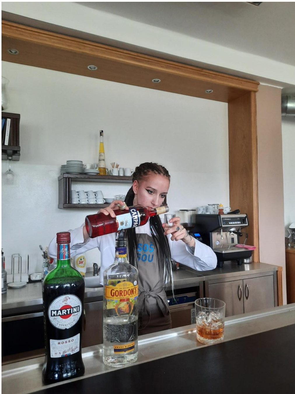
Obr. 9 – Barmanský kurz 2. KČ ve studiu nápojové gastronomie

gastronomických témat, a to za podpory odborníků z praxe, Jihočeské hospodářské komory a za podpory vedení školy.