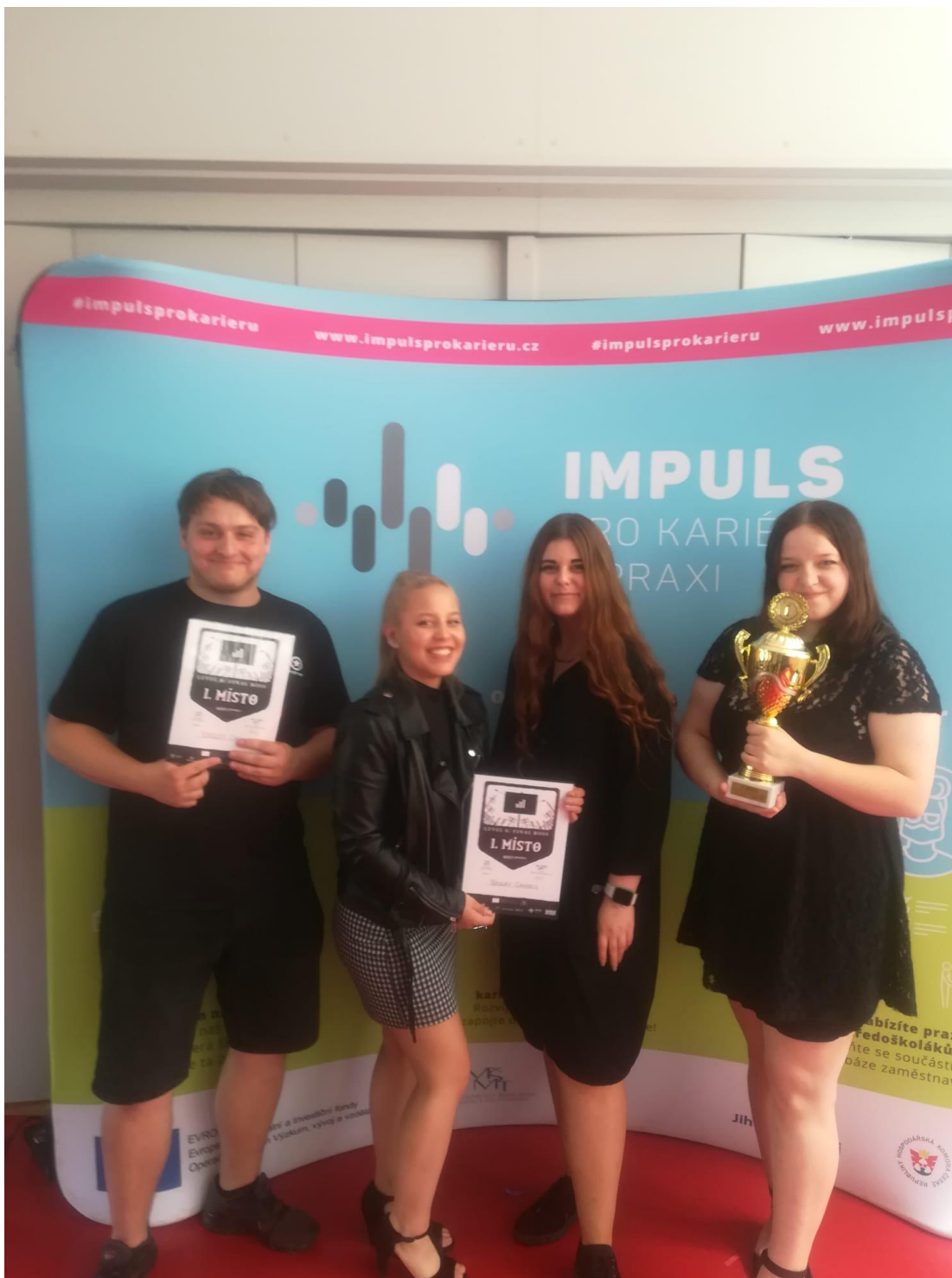
Obr. 17 –Vítězná firma Waxly Candles