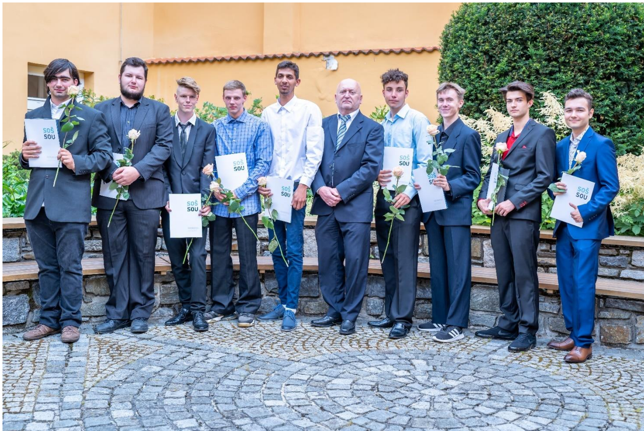
Obr. 2 - Absolventi 3.MZ