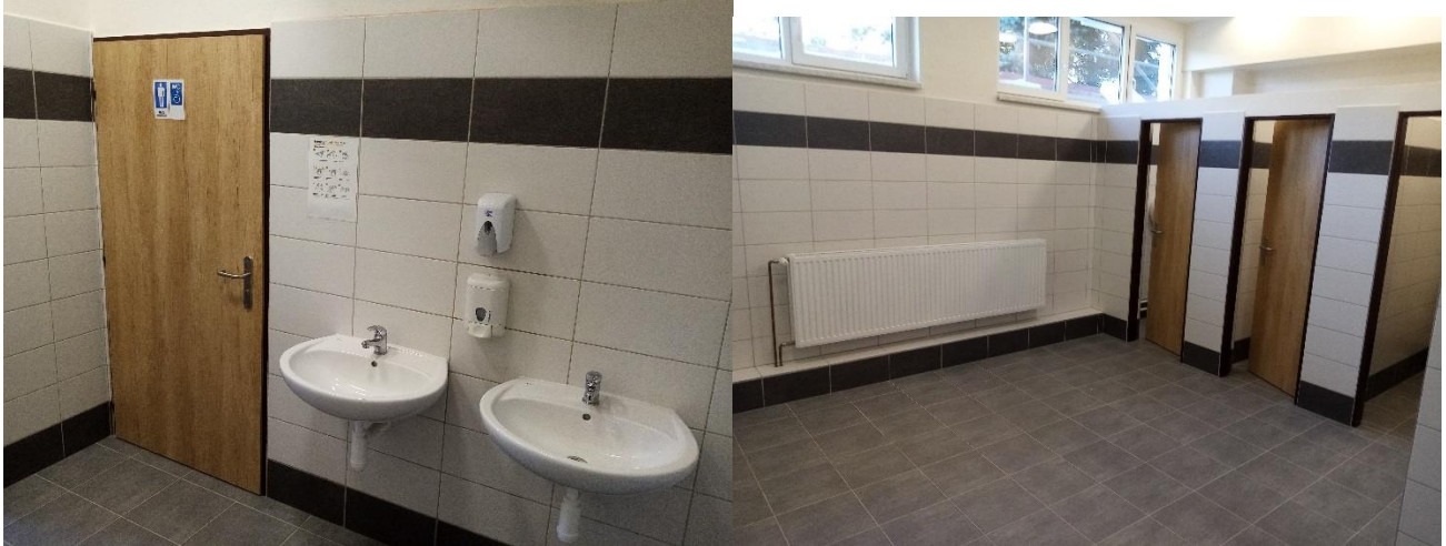
Obr. 23 – rekonstrukce toalet na SOU, Pohorská 86