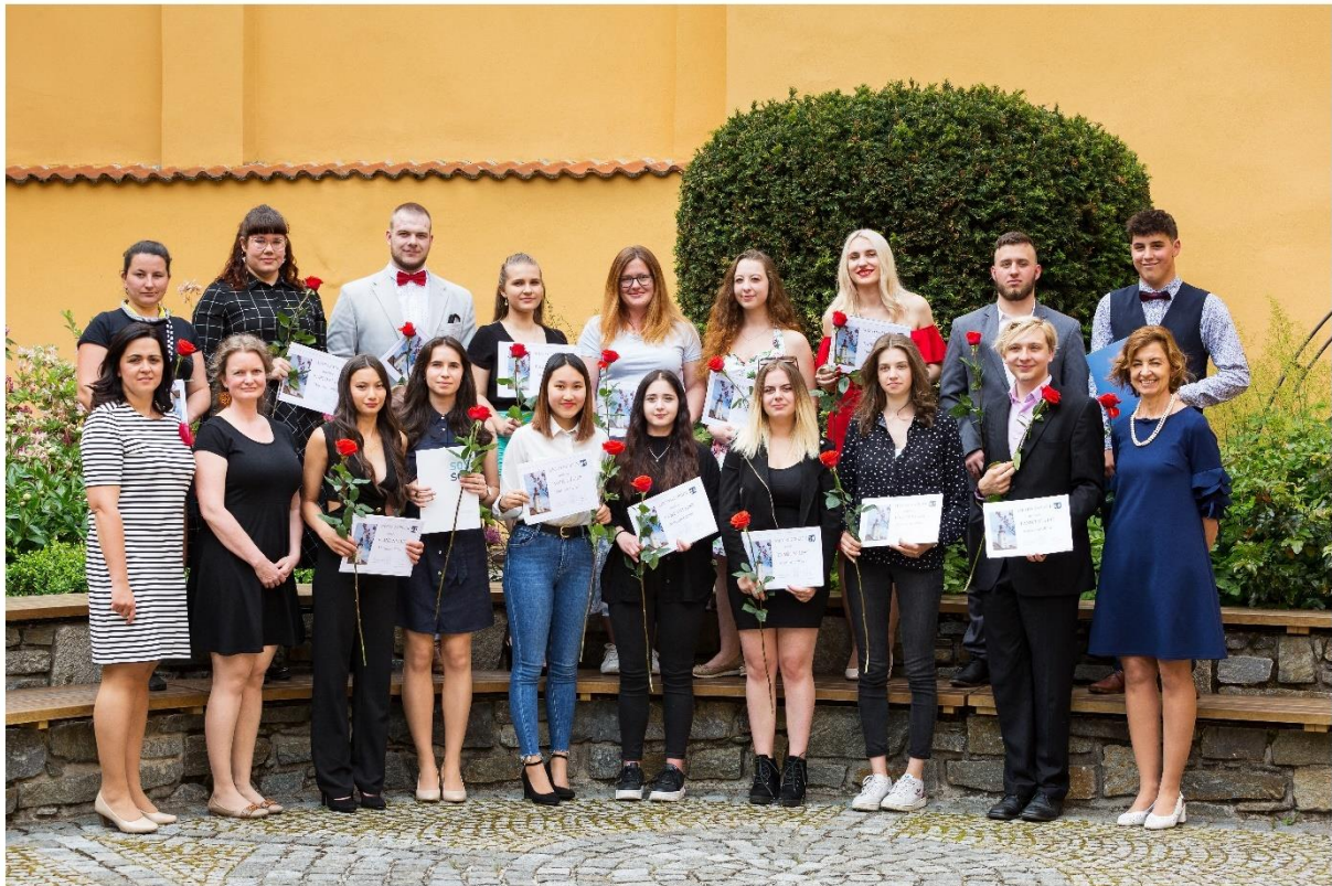
Maturanti SOŠ a SOU Kaplice