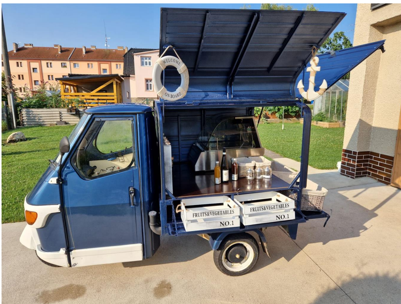
Obr. 10 – Slovanská rikša

Zúčastňujeme městských slavností, Kaplického Ušáka a masopustu, které si už návštěvníci nedovedou představit bez naší kaplické cmundy, koláčků a jiných tradičních českých pokrmů. Novinkou naší prezentace na gastroakcích byl prodej nápojů ze slovanské říkši pod taktovkou p. Homolky, vedoucího restaurace Slovanský dům.