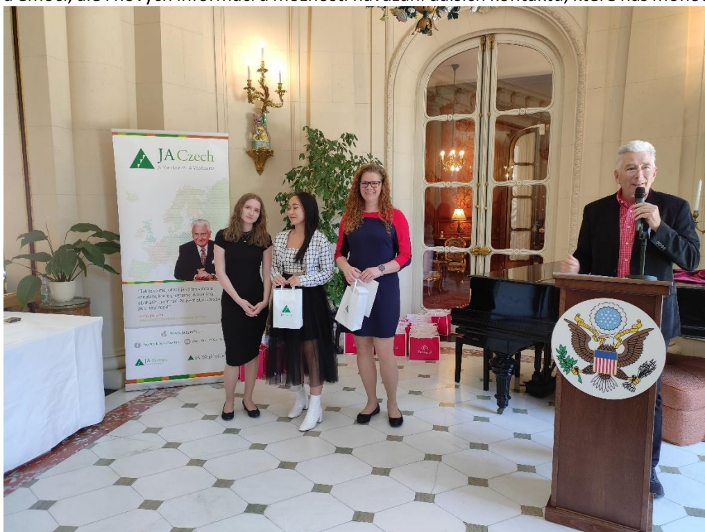
Obr. 16 – Studentská firma Cup Of Joy na americkém velvyslanectví v Praze

Pro pedagogy a žáky to byla jedinečná příležitost setkat se i s významnými hosty, mezi které patřili zástupci společností Microsoft, Dermacol, Samsung, New Your University Prague, a další. Setkání bylo plné očekávání a emocí, ale i nových informací a možností navázání dalších kontaktů, které nás mohou v dalším roce posunout zase o kousek dál.