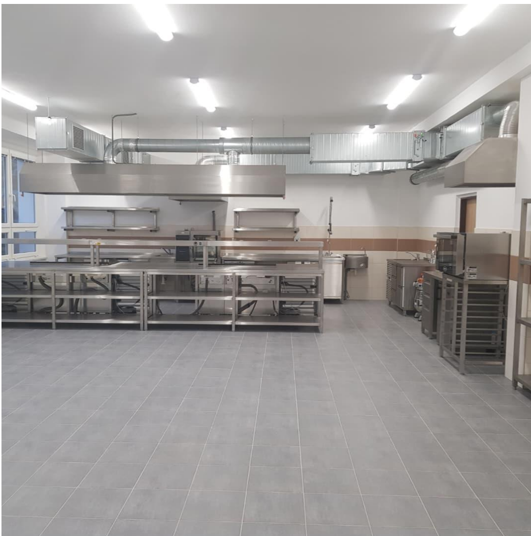
Obr. 24 – studio kuchařské gastronomie