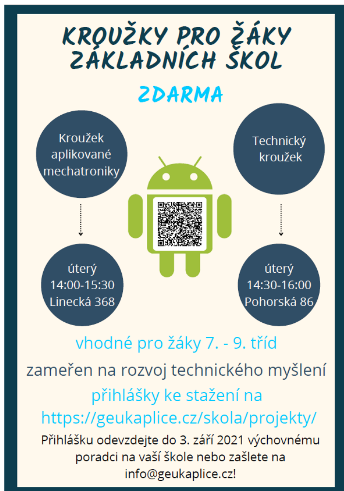
Obr. 11 – Kroužek aplikované mechatroniky

Kroužky polytechnického charakteru zdarma