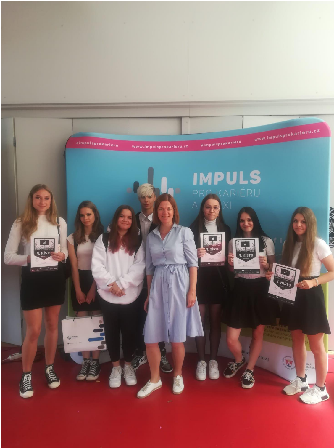
Obr. 18 –Firma Plafi na skvělém 4. místě