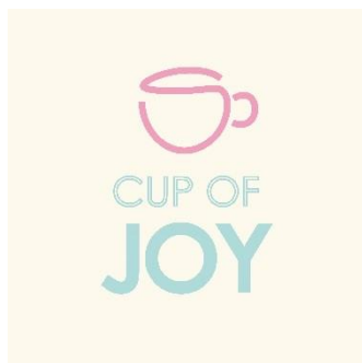
Obr. 15 – Studentská firma Cup Of Joy

Ovšem v průběhu roku je čeká i porovnání s dalšími společnostmi. Díky JA CZECH mají možnost účastnit se různých soutěží, kde bojují o přízeň poroty i zákazníků s firmami z celé ČR. Největší porovnání a zhodnocení jejich dosavadní činnosti pak mohou získat na veletrhu studentských firem JA Expo, které se koná každoročně v Praze. Další příležitostí, kde se ukázat jsou dílčí soutěže pořádané taktéž JA CZECH. Jednou z těchto soutěží bylo TOP LOGO, kde se hodnotilo grafické zpracování loga. Všechny 3 naše studentské firmy se této soutěže účastnily a společnost Cup Of Joy obsadila v krajském kole 1. místo a v národním kole krásné 3. místo.